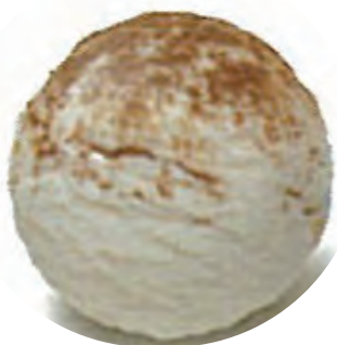
Cod. H701385 LECHE MERENGADA