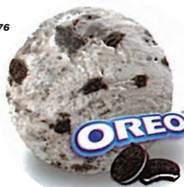
Cod. H735601 NATA CON OREO