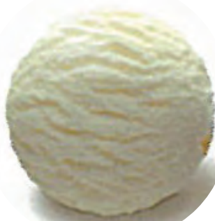
Cod. H701825 VAINILLA