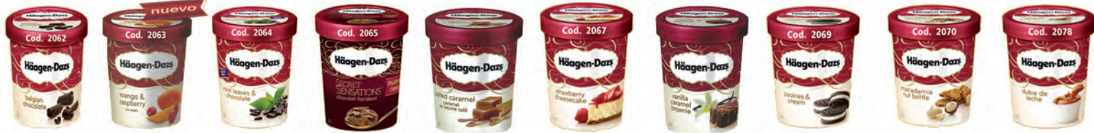
Macadamia Nut Brittle