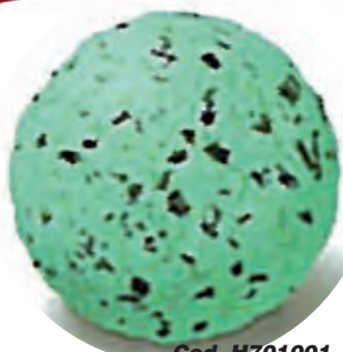
Cod. H701001 MENTA CON CHOCOLATE