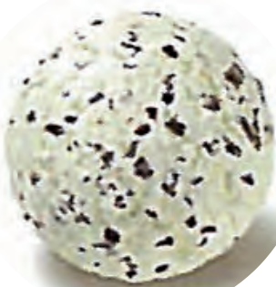
Cod. H701720 STRACCIATELLA