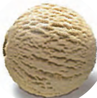
Cod. H706756 TURRÓN