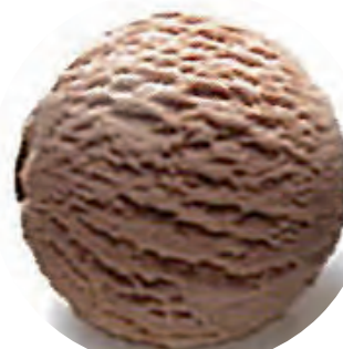
Cod. H701090 CHOCOLATE