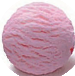
Cod. H704176 FRESA