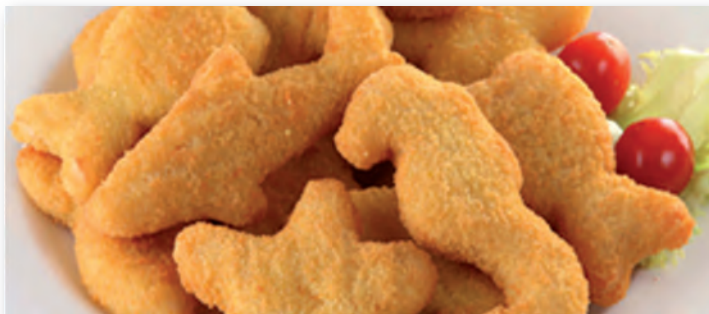
0475 FIGURITAS DE MERLUZA REBOZADAS BOLSA DE 300 GRS.