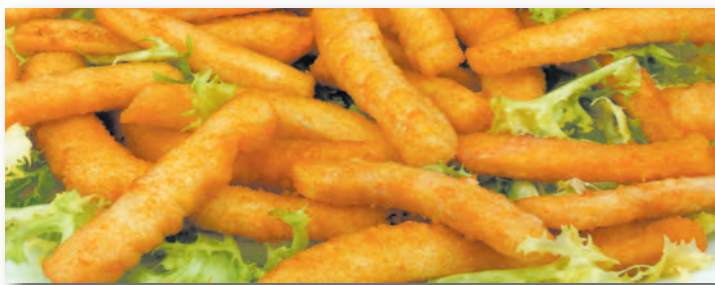
7008 RABAS DE CALAMAR 1KG. REBOZADO MUY LIGERO (TIRAS)