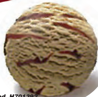
Cod. H701392 DULCE DE LECHE VETEADO