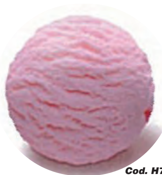
Cod. H704176 FRESA