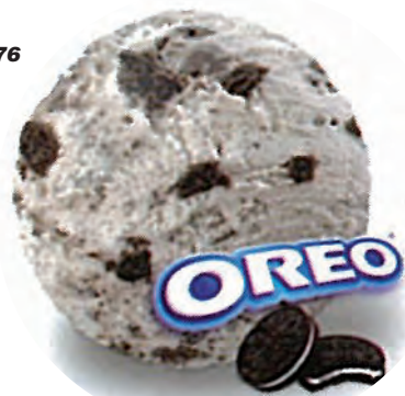
Cod. H735601 NATA CON OREO