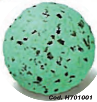
Cod. H701001 MENTA CON CHOCOLATE