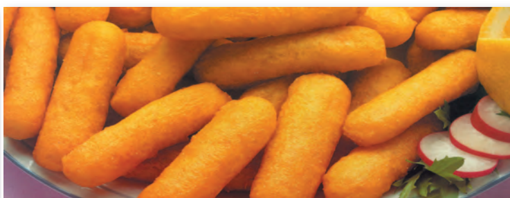
7019 PALITOS DE MERLUZA (7,38 €/kg.) 400 GRS.