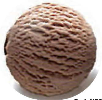
Cod. H701090 CHOCOLATE