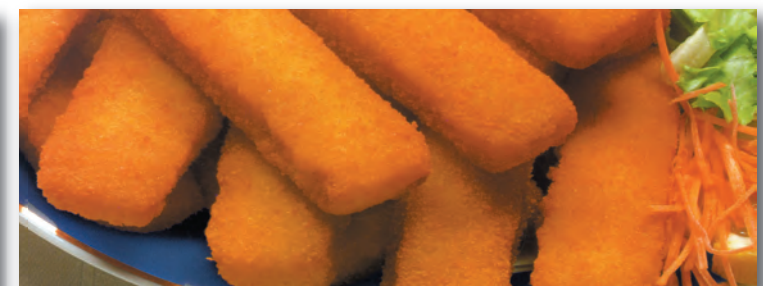
7026 VARITAS MERLUZA (8,13 €/kg.) REBOZADAS 400 GRS.