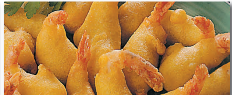
7015 GAMBAS A LA GABARDINA 400 GRS. - (13,88 €/kg.)