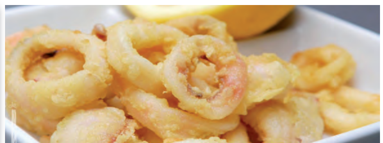
7041 CALAMAR ANILLAS enharinados a la andaluza Bolsa de 500 grms. (17,90 €/kg.)