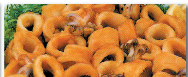
0830 CHIPIRÓN ENHARINADO Bolsa 300 Gs. (14,17 €/kg.)